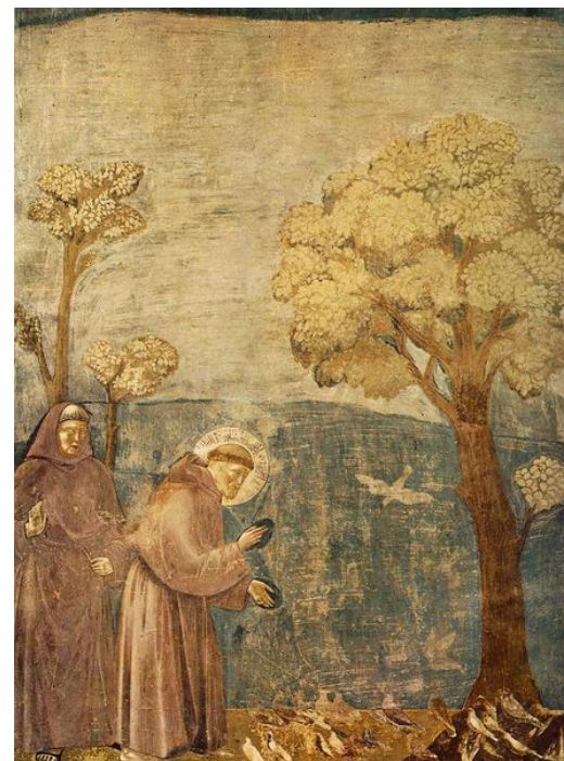
S. Francesco - Giotto

Uno STILE di VITA che sa DISTINGUERE tra le NECESSITÀ ed i BISOGNI .